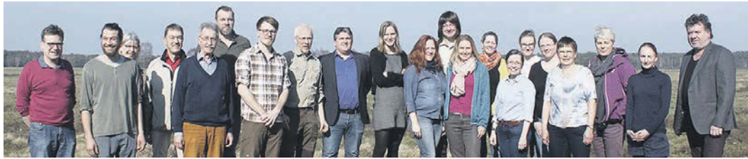
Die Teilnehmer des Lehrgangs werden in Zukunft naturinteressierte Gäste durch die Lüneburger Heide führen

Das Kurscurriculum, das unter anderem die didaktischen, ökologischen und auch