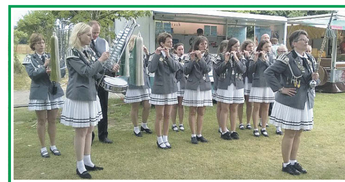
Der Spielmannszug wird wieder für die musikalische Begleitung sorgen